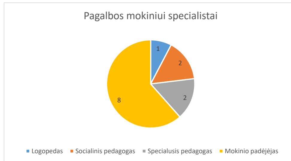
4 lentelė. Pagalbos mokiniui specialistai

Įgyvendinant 2024 m. m. progimnazijos veiklos planą, buvo siekiama: